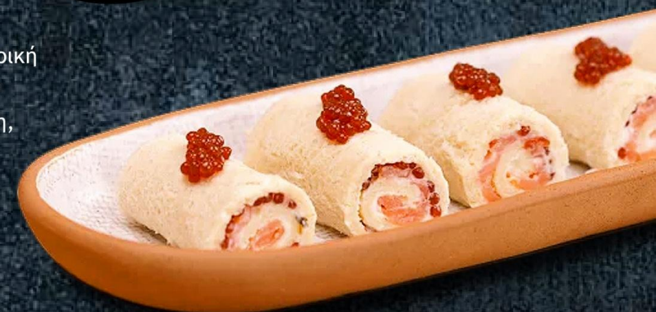
ΡΟΛΑΚΙΑ ΜΕ ΠΕΡΛΕΣ ΣΟΛΩΜΟΥ & ΑΝΤΖΟΥΓΙΑΣ

Ο καλύτερος γαύρος από την Κανταβρική θάλασσα μετατρέπεται σε πέρλες που όχι μόνο διατηρούν όλη τους τη γεύση, αλλά και την ενισχύουν, ενώ επιπλέον μειώνουν τόσο τις θερμίδες του, όσο και την περιεκτικότητά σε αλάτι.